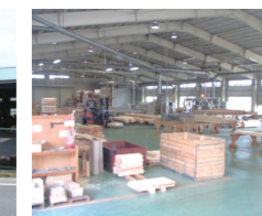
プレカッタ工場内