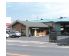
真庭プレカッタ事務所・工場

山間地の為加工設備は入母屋作りや大型物件にも対応する様、横架材で最大150mm×450mm×8m・柱は180mm角×9mまで機械加工しております、また9m以上の長尺材や梁丸太や合掌など機械では対応できない加工には大工による手加工を実施しています。加工製品は本社工場で生産する県産「美作松・杉」など優良な製品を使用し、CAD打合せや入力に際してはお施主様の気持ちになって細かい所まで行っております、プレカッタのことなら一般住宅から公共建築物まで致していますので是非お問い合わせをお待ちしています。