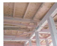
岡山県産スギの垂木