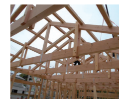
五軸・手加工により、大スパン合掌組にも対応可能

最新の機械を導入し、様々な加工のご要望に幅広く対応いたしております。 丸太梁の機械加工、斜め・登り加工をはじめ、平成26年11月に導入した横架材加工機により金物工法にも対応可能となりました。 プレカッタだけでなく、住宅建材・設備機器・サッシ・サイディング工事まで対応しております。