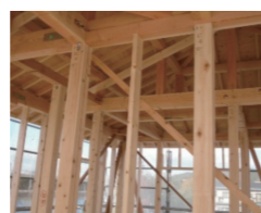
岡山県産ヒノキの柱

当社は、山林経営から木材・建材の販売、加工を手掛け、創立65年を迎えた木材ビジネスの老舗です。高精度なプレカッタ加工機を最大限活かせるよう、木の特性を熟知したプロが加工前の木材を厳選し、適材適所に使用することで、高品質なプレカッタ製品を提供しております。使用する木材も老舗問屋の機能を最大限に活かし、県産材をはじめ多樹種の商品を取り扱っておりますし、プレカッタ加工もこれまでの構造躯体のみならず、羽柄やパネルの加工、金物工法への対応など、お客様のあらゆるニーズに最大限お応えします。また、木材に携わる企業の責務として、間伐材の有効利用(LVL事業)や工場から出る端材(木くず)をバイオマス燃料へと、木材を余すことなく活用し、森林保全・環境問題にも取り組んでいます。木材利用ポイント・県産材の利用など、どんなことでもお気軽にお問い合わせ下さい。ご不明な点はお問い合わせください。