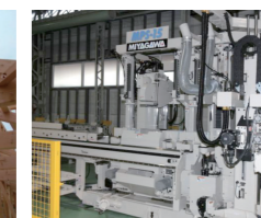
平成26年11月には横架材加工機を一新