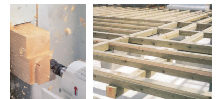
プレカット加工機 防腐加工した床下材

当社は、平成元年より開設のプレカット実績を活かして高品質のプレカット製品を提供する事で現場での作業効率と安全性をサポートしております。プレカット加工能力:月産加工坪数5,000坪 加工種類:在来木造工法加工・金物工法加工(SSマルチ・プレセッター・プレセッターMタイプ・プレセッターSU・HS)、羽柄材加工・野地・床パネル加工 県産材加工の実績としては、加工物件の70%が県北の製材所もしくは集成材工場より製品を納入し加工を行っています。岡山県産材補助金対象物件は、前年度では68棟の実績を残しています。創業以来80年にわたって蓄積したもくざい保存処理技術を活かし、住宅用関連資材、景観:公園施設の設計、製造をおこなっています。景観:公園修景施設加工:東屋、パーゴラ、木橋、遊具、ベンチ、サイン、木柵、土用資材等 不明な点はお問い合わせください。